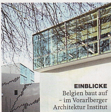
EINBLICKE Belgien baut auf – im Vorarlberger Architektur Institut

Belgien: Im Vorarlberger Architektur Institut zeigt eine Ausstellung der flämischen Architekten De Vylder Vinck Taillieu, wie Grenzen gekonnt überschritten werden können. Das Trio aus Gent macht vor, wie Architektur jenseits des Gewohnten aussehen kann.