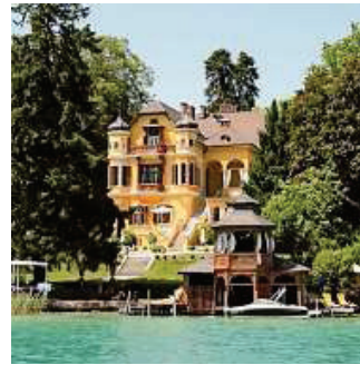
Die Villa Miralago, wo die Karte am 10. Mai präsentiert wird, 1893 errichtet und von Architekt Carl Langhammer geplant