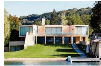
Haus P in Auen, 2006 von einem privaten Bauherrn errichtet, Architekt R. Schmid