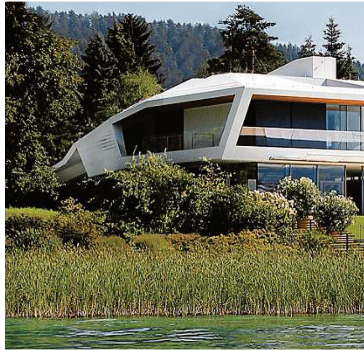
Eines der spektakulärsten Gebäude am See: die 2013 erbaute Residence P PANOVISION (7)