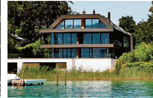
Villa Sennewald, 2011, Krumpendorf, Architekt: Ogris & Wanek, privater Bauherr