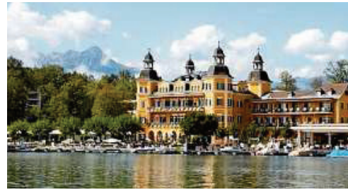
Schloss Velden aus dem Jahr 1603 ist aus Film und Fernsehen bekannt