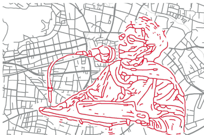
Bildbearbeitung: Philosophische Versuchsreihen

Am Weg treffen wir auf Kunstinterventionen, Zeitzeug*innen sowie gesellschaftspolitische Initiativen und stärken uns bei einem gemeinschaftlichen Mittagessen in einer historischen Sozialinstitution. Am Ziel erwartet uns eine Führung durch die Ausstellung »Frauen Bauen Stadt – The City Through a Female Lens« und »Pionierinnen der Architektur« sowie die Tanzperformance »küche – kein weg«.