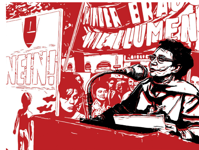
Margarete Schütte-Lihotzky als mahnende Rednerin für Frauenrechte und gegen atomare Aufrüstung 1961