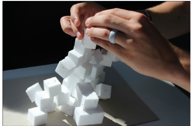
Trans Form

Der Workshop ermöglicht erste Erfahrungen im Umgang mit einer Entwurfsausgabe. Ein Kubus dient als Ausgangslage für spannende räumliche Transformierungen, in denen die Jugendlichen einen Einblick in die Welt architektonischer Entwurfsmethoden bekommen.