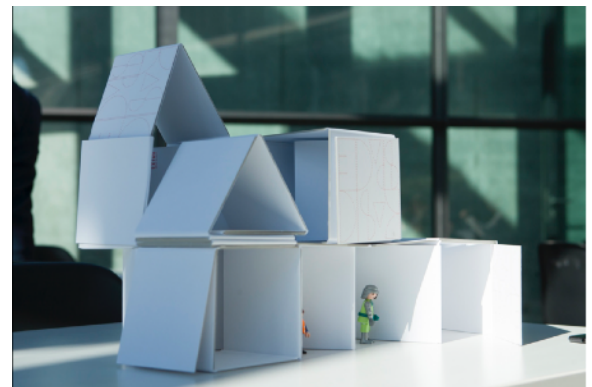
Basic Space

Ein einfaches Raumwerkzeug der französischen Gruppe EXTRA! bietet vielfältige Experimentiermöglichkeiten und unzählige verblüffende Variationen der Raumveränderung. Die kleinen Räume können einzeln gebaut oder miteinander verbunden werden und mit Spielfiguren belebt werden.